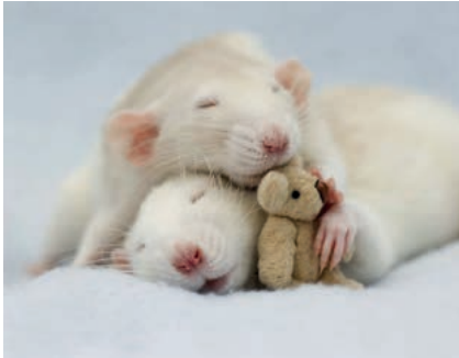
uáš východiskový obrázok