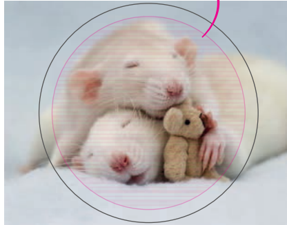
viditeľná časť odznaku