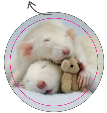
obrázok v ohybe odznaku